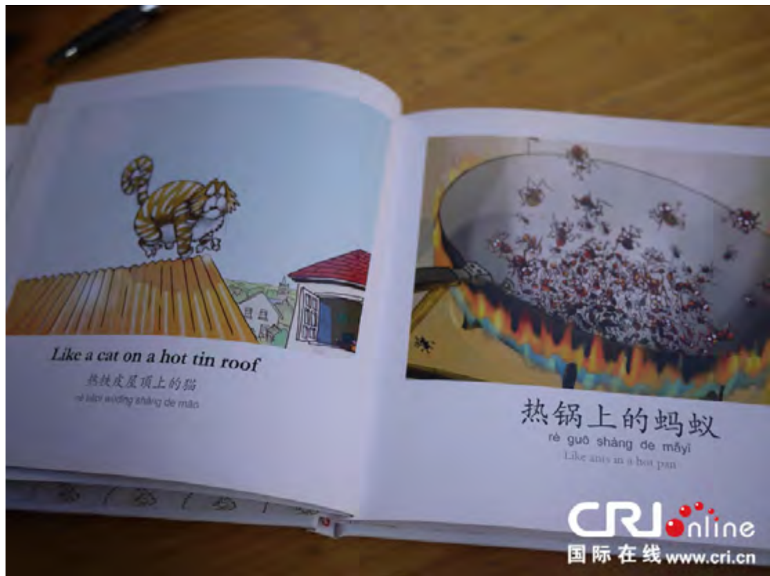
由 JASON 创作的英汉同义习语工具书内页

除了这本已经出版的工具书，JASON 目前正在忙于第二本书的创作。“这本跟画一样，就是大理的各方面的人文风景，吃的都有的，现在正在写，画一个叫作“速写本”，但是还要配上文字，所有的东西，从动物到小吃，还有神话，各方面都要写一点。”